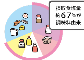
厚生労働省 令和元年国民健康・栄養調査より作成

日本人が摂取している塩分のうち、調味料由来が67%となっています。減塩するには、「調理に使う調味料」、また「料理にかける食卓調味料」を減らすことが有効です。子どもが好きなマヨネーズ、ドレッシング、ケチャップ、ソースの使い過ぎには注意しましょう。