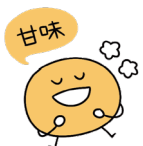
甘味 エネルギー源となり、心を落ち着かせる