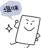
塩味 体液の均衡を保ち、筋肉の動きを助ける