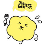
酸味 疲労の回復に役立ち、食欲を増進させる