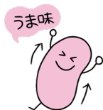
うま味 食欲を増進させ、成長を促す