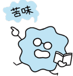
苦味 解毒作用があり、消化を助ける